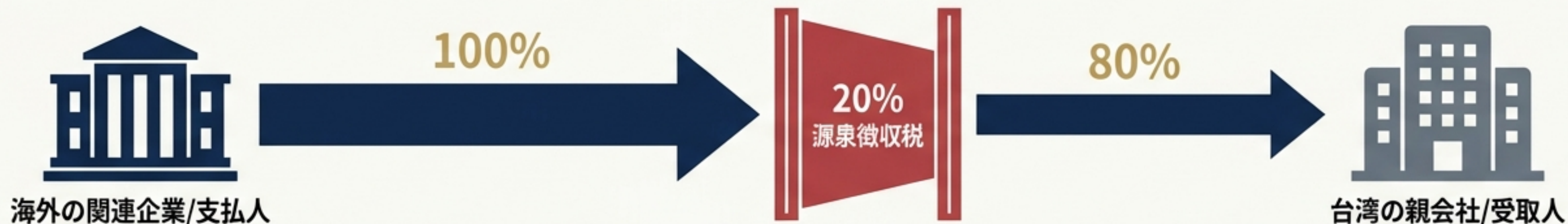
シナリオ B: DTAを活用したゼロ税率免除